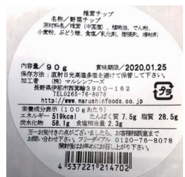
正しい商品のラベル