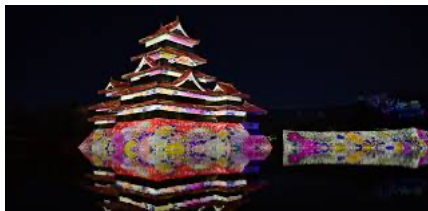
国宝 松本城のレーザーマッピング！これは必見です！

発行：(株)マルシンフーズ 本社：伊那市西箕輪 3900-162 TEL:0265-76-8078 FAX:0265-76-8182 Mail:info@marushinfoods.co.jp